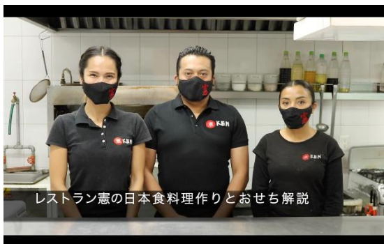
レストラン憲のおせち作りと解説