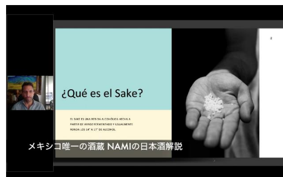
酒蔵“NAMI”の酒造りの紹介