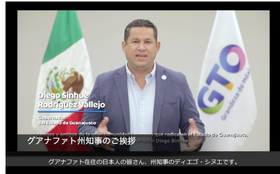
ディエゴ・シヌエ州知事