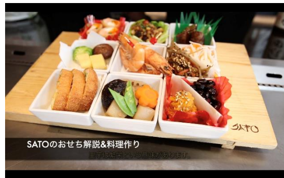
レストラン SATO のおせち料理