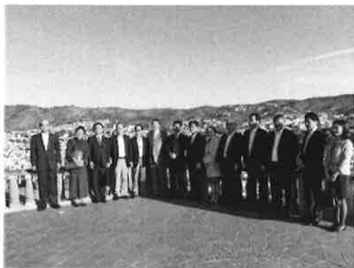
グアナファト市内を視察 ピピラの丘にて

翌22日は、マツダメキシコ工場、ヒロテックメキシコ工場などを視察後、広島県内の自動車関連メーカーを中心に当日、設立された「グアナファト広島アミーゴ会」との懇親会が開催されました。アミーゴ会は会員31社で構成され、当日は27社から約60名が出席し、懇親会を盛り上げました。