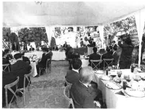
広島県・グアナファト州友好提携1周年記念式典