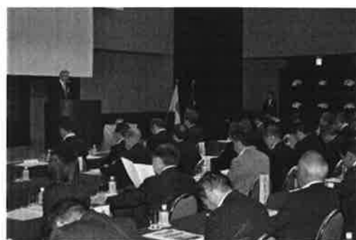
設立総会で挨拶されるアルマーダ・メキシコ大使