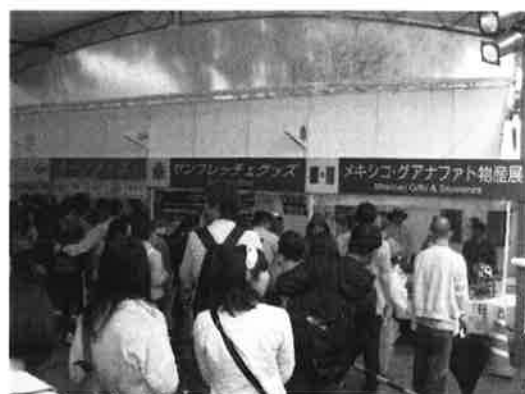
マツダ Zoom-Zoom ひろば内での物販