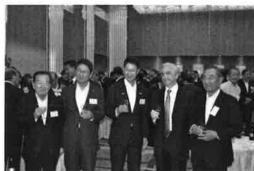
懇親会にて、左より平田前県議会議長、金井会長、湯崎知事、アルマーダ大使、林県議